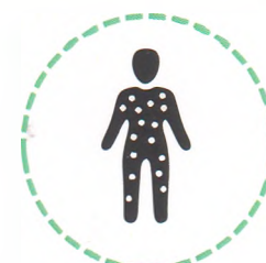
Характерная сыпь на коже

Корь настолько заразна, что до 95% непривитых контактных тоже заразятся. СПЕЦИФИЧЕСКОГО ЛЕЧЕНИЯ КОРИ НЕТ.